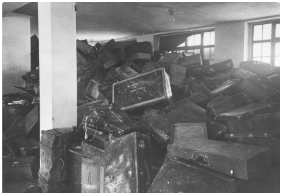
(Gedenkstätte und Museum Auschwitz-Birkenau, Datum unbekannt)

Von Häftlingen ins Lager mitgebrachte Koffer im Magazin „Kanada“. Die Archivierung und Verwaltung des persönlichen Eigentums der Häftlinge galt als privilegierte Arbeit, da die Häftlinge sich illegal mit den mitgebrachten Gegenständen versorgen und diese als Tauschobjekt im Lager verwenden konnten. Zusätzlich wurde die Arbeit unter Dach verrichtet, so dass die Häftlinge nicht den Wetterverhältnissen ausgesetzt waren.