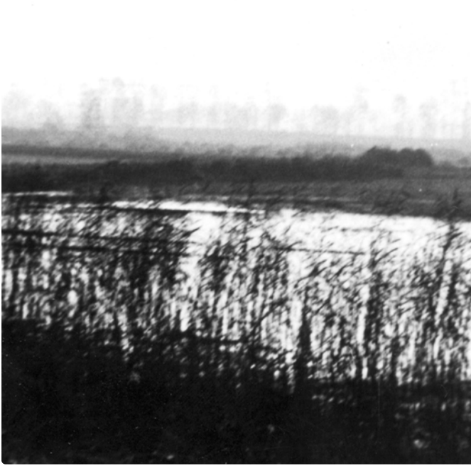
Fisch- und Geflügelzucht Harmense. Die Säuberung der Fischteiche galt als schwere Arbeit, bei der die Häftlinge häufig erkrankten, aufgrund der Krankheit selektiert und in den Gaskammern ermordet wurden.

(Gedenkstätte und Museum Auschwitz-Birkenau, Datum unbekannt)