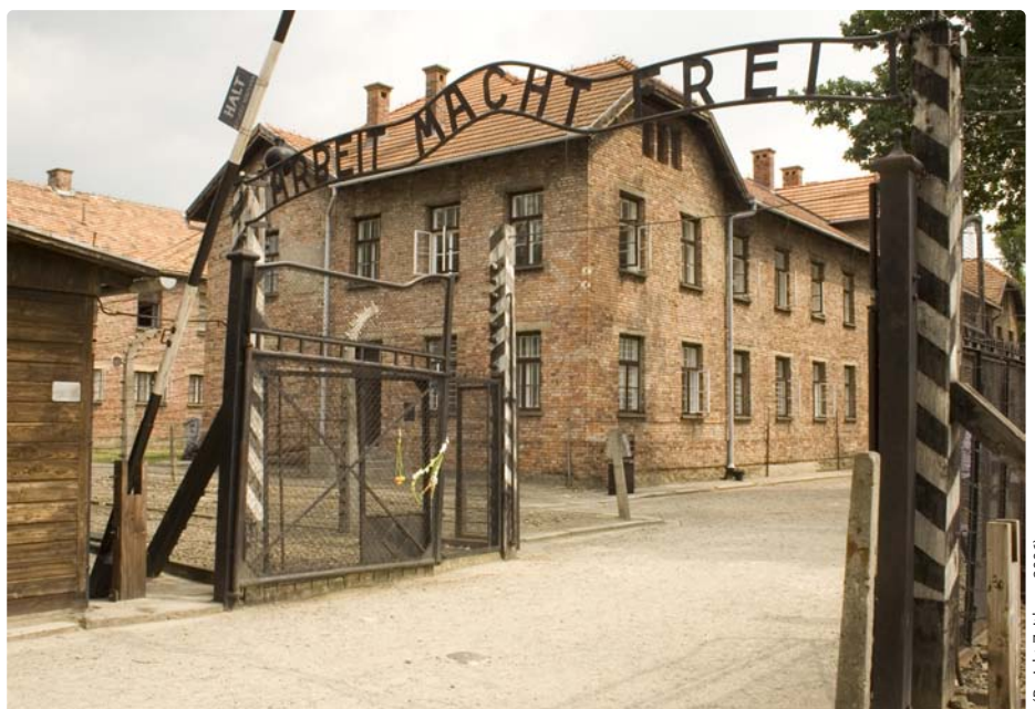
(Projekt Zeitlupe, 2006)

Der Eingangsbereich des Stammlagers Auschwitz. Bereits im Ersten Weltkrieg war hier ein Lager für polnische Saisonarbeiter errichtet worden, das 1940 von den Nationalsozialisten zum Konzentrationslager ausgebaut wurde. Zur Beherbergung einer möglichst großen Zahl von Häftlingen mussten die einstöckigen Baracken auf zwei Etagen aufgestockt werden.