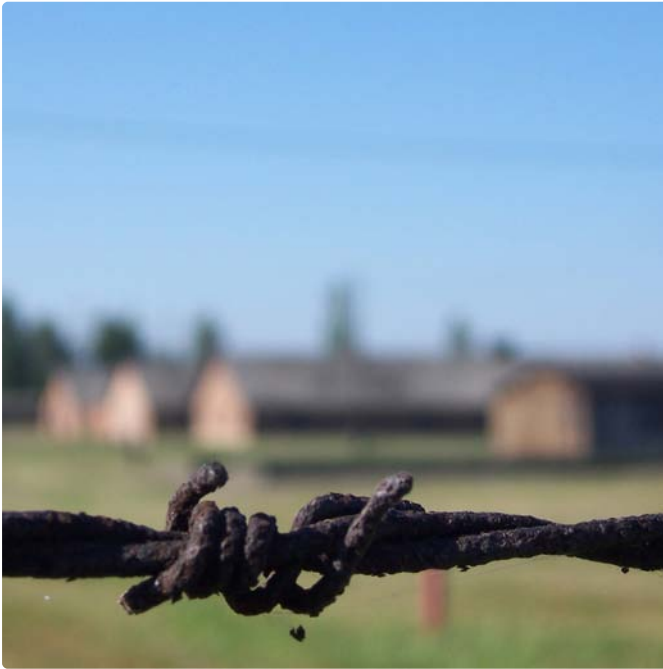
Stacheldrahtzaun im Frauenlager von Auschwitz-Birkenau, durch den verschiedene Lagerabschnitte innerhalb eines Konzentrationslagers voneinander abgegrenzt wurden.

am 27./28. Februar 1933 erlassen hatte. Sie berechtigte dazu, eine Person auf unbestimmte Zeit zu inhaftieren, ohne dass tatsächlich ein Verstoß gegen geltendes Recht vorliegen musste, sondern auf die bloße Annahme hin, die Person „gefährde die Sicherheit von Volk und Staat“. Da zudem keine Möglichkeit der Berufung auf höhere Instanzen vorgesehen war, bildete die so genannte „Schutzhaft“ ein wirksames Instrument zur Ausschaltung politischer Gegner. Die auf diese Weise „vorbeugend in Gewahrsam genommenen“ Personen wurden zunächst in Polizei- und Justizgefängnissen festgehalten; da deren Kapazitäten aber schon sehr bald nicht mehr ausreichten, musste man andere Möglichkeiten zur Unterbringung der Gefangenen finden. In diesem Zusammenhang entstand am 22. März 1933 auf Befehl des Reichsführers SS Heinrich Himmler das erste reguläre Konzentrationslager in Dachau bei München. Ab dem 26. April 1934 durfte die „Schutzhaft“ nur mehr in Polizei- und Justizgefängnissen oder aber in Konzentrationslagern vollstreckt werden, ab dem 25. Januar 1938 nur noch in Konzentrationslagern. Die Bewachung erfolgte grundsätzlich durch die SS.