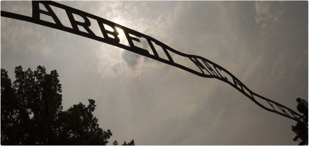
Das Tor am Eingang des Stammlagers (Projekt Zeitlupe, 2006)