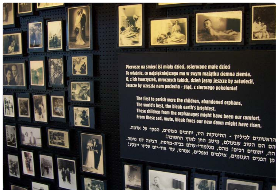
(Projekt Zeitlupe, 2006)

Teil der Ausstellung in der ehemaligen „Sauna“ von Auschwitz-Birkenau. Diese Bilder wurden auf dem Gelände des Magazins „Kanada“ gefunden; es war aber nicht möglich, sie einzelnen Häftlingen zuzuordnen. Seit 1947 befindet sich auf dem ehemaligen Lagergelände das Staatliche Museum Auschwitz-Birkenau. 1979 wurde es in die Liste des UNESCO-Weltkulturerbes aufgenommen.