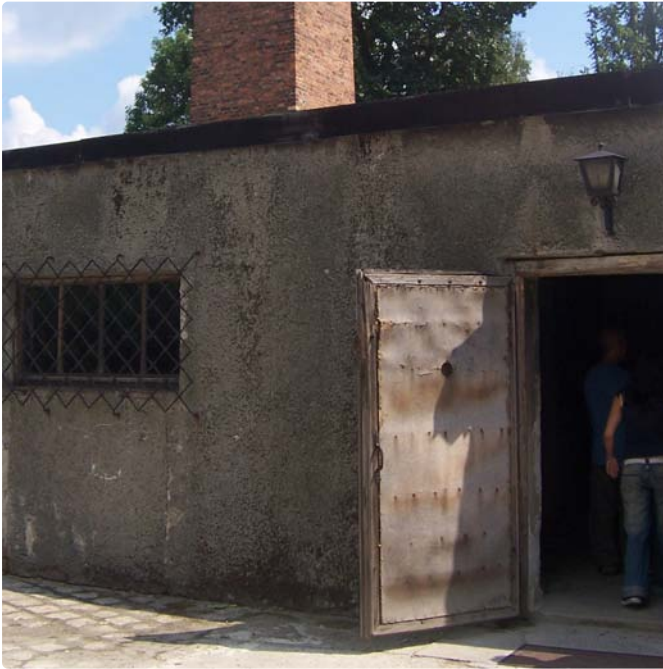
Das Krematorium I im Stammlager. 1941 wurde die Leichenhalle zur Gaskammer ausgebaut und das Krematorium selbst erweitert, um eine größere Zahl von Leichen verbrennen zu können.

den häufig vier bis fünf Leichen gleichzeitig verbrannt, so dass sich die Verbrennungszeit auf etwa 30 Minuten verlängerte. Infolge dieser Überbelastung traten an den Verbrennungseinrichtungen wiederholt Schäden auf, so dass die Krematorien zeitweise ausfielen und die Leichen wieder unter freiem Himmel verbrannt werden mussten. Die nicht vollständig verbrannten Knochen fielen durch einen Rost in Aschebehälter, wo sie zu Knochenmehl zerschlagen wurden. Die Asche aus den Krematorien wurde ebenfalls in Flüssen und Teichen entsorgt oder zur Düngung der zu den Landwirtschaftsbetrieben gehörigen Felder verwendet.