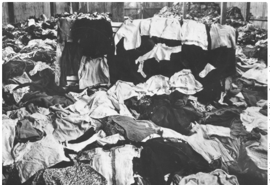
(Gedenkstätte und Museum Auschwitz-Birkenau, Datum unbekannt)

Magazin, in dem die Bekleidung der Häftlinge aufbewahrt wurde. Mit dem Beginn der Massenvernichtungsaktionen kam der zuständigen Abteilung IV der Lagerleitung eine weit höhere Bedeutung zu als zuvor, da die Nutzung der persönlichen Eigentums der Ermordeten zur Stärkung der wirtschaftlichen Position der SS führte.