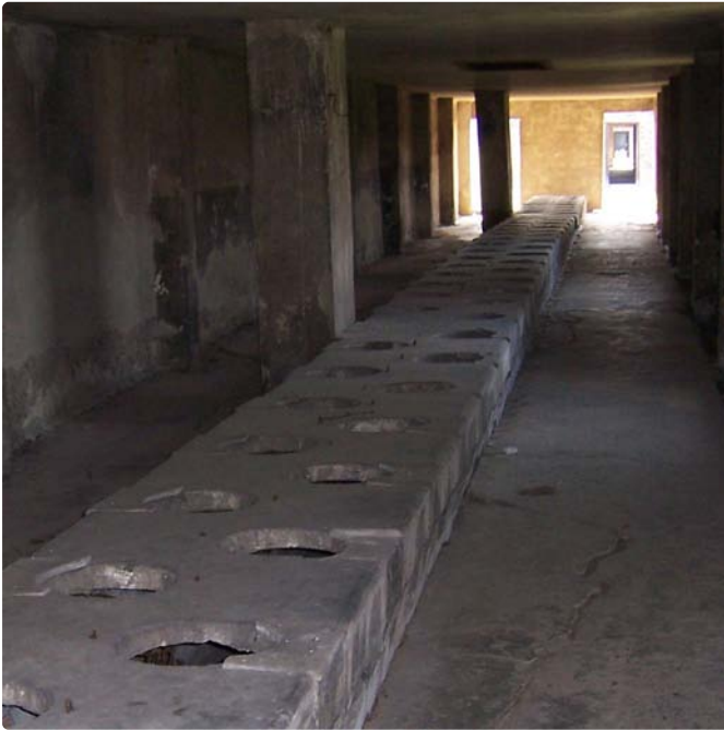
Latrinenbaracken im Frauenlager von Auschwitz-Birkenau. Da die Benutzung nur zu bestimmten Zeiten erlaubt war, waren die Latrinen ständig überfüllt und alles musste in fliegender Hast verrichtet werden.

ausgenommen. Auf diese Weise entstand im Lager ein reger Tauschmarkt: Häftlinge, die beim Gemüseanbau eingesetzt waren oder Zugang zu den Lebensmittelmagazinen hatten, „organisierten“ Nahrungsmittel und boten diese dann zum Tausch an.