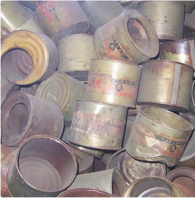
Behälter für das Gas Zyklon B, das zur Tötung der Menschen in den Gaskammern verwendet wurde. Nach dem Einwurf in die Schächte der Gaskammer trat innerhalb weniger Minuten der Tod ein.

ebenerdige Waschraum in den Krematorien II und III, in dem bei Transporten von weniger als 200 Personen Erschießungen durchgeführt wurden, existierte hier nicht. Alle vier Gebäude waren außerhalb der Häftlingslager angelegt und zusätzlich mit Stacheldrahtzäunen abgesperrt. Damit keine Einsicht von den Häftlingsunterkünften aus möglich war, wurde um die Krematorien herum ein Grüngürtel angelegt, der das Gelände tarnte.