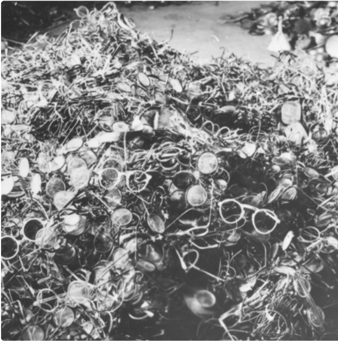
Sammlung von Brillen der in den Gaskammern Ermordeten. Brillen, Prothesen, Zahngold und die Haare der Frauen wurden den Toten noch in der Gaskammer von den Häftlingen des Sonderkommandos abgenommen.

(Gedenkstätte und Museum Auschwitz-Birkenau, Datum unbekannt)