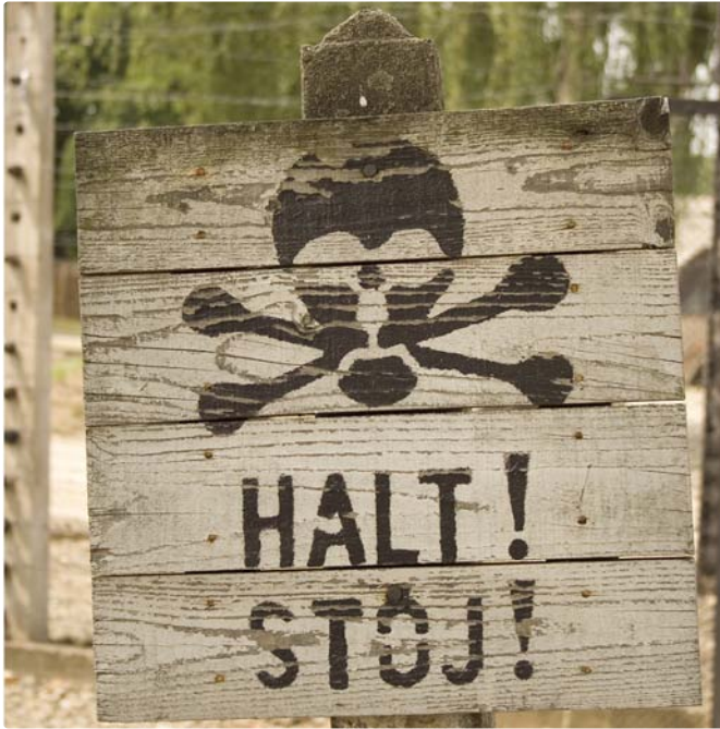
Sicherheitszone um den äußeren Lagerzaun. Weiter als bis zu diesem Schild an die Umzäunung heranzugehen, war bei Todesstrafe verboten. Die Einrichtung einer solchen Sicherheitszone erschwerte die Hilfsaktionen von außerhalb des Lagers.

schaffen, unter denen man den Häftlingen Hilfe zukommen lassen konnte. Weitere Möglichkeiten bot die Tätigkeit von so genannten Zivilarbeitern, die bei ortsansässigen deutschen Firmen beschäftigt waren – es handelte sich jedoch um Polen – und die im Auftrag der Lagerleitung Bauarbeiten innerhalb des Lagers ausführten. Sie konnten im Zuge ihrer Arbeit Kontakte mit Häftlingen unterhalten, die viele dazu nutzten, den Häftlingen Hilfe zu leisten.