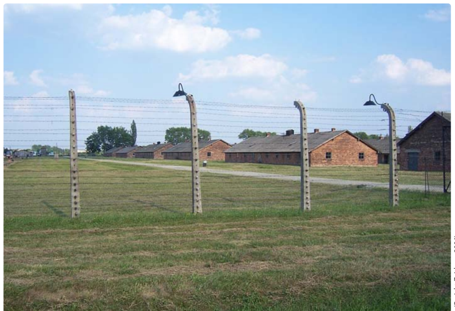
(Projekt Zeitlupe, 2006)

Das spätere Frauenlager in Auschwitz-Birkenau. Ursprünglich war dieser Bereich als Internierungslager für russische Kriegsgefangene vorgesehen. Diese hatten jedoch unter härtesten Bedingungen zu leiden, so dass die Sterblichkeitsrate unter ihnen sehr hoch war und das vorgesehene Lager zu groß war. Dadurch entstand hier zusätzlicher Raum zur Internierung von Frauen.