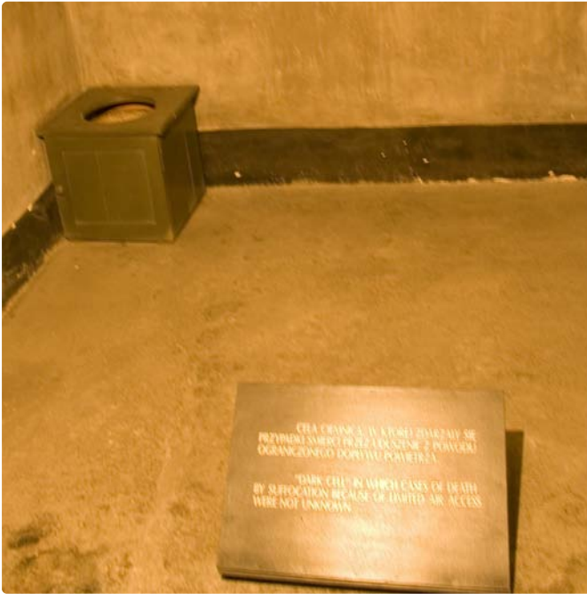
Gedenkstein in der Hungerzelle des Strafblocks 11 im Stammlager. Dort eingesperrt zu werden galt als eine der schlimmsten Strafen und führte häufig zum Tode.

merzt werden sollten. Nachdem diese im Juli auf Juden und Häftlinge in den Konzentrationslagern ausgeweitet worden war, daraufhin 575 Häftlinge selektiert und in der Euthanasieanstalt Sonnenstein mit Kohlenmonoxid getötet worden waren, strebte man eine Optimierung des Tötungsverfahrens mit Gas an und experimentierte zu diesem Zweck in Auschwitz erfolgreich mit Zyklon B. Etwa zum gleichen Zeitpunkt wurden erstmals Versuche durchgeführt, kranke Häftlinge mittels Phenolspritzen in den Herzmuskel gezielt zu töten. Von dieser Methode des „Abspritzens“ wurde in den Folgejahren häufig im Zusammenhang mit medizinischen Experimenten an Häftlingen Gebrauch gemacht, ebenso zur Beseitigung von Zeugen oder als Strafmaßnahme. Insgesamt war der Strafenkatalog erheblich erweitert worden; nachdem bereits im April eine Gruppe von Häftlingen zum Hungertod verurteilt worden war, wurden im November erstmals Häftlinge durch Genickschuss formell exekutiert.